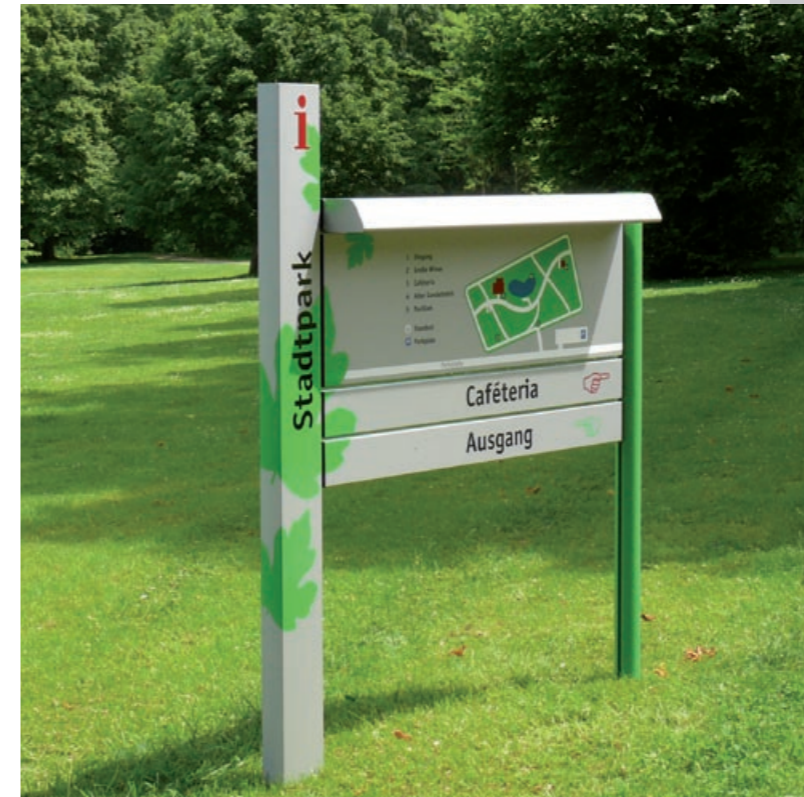
Infopunkt mit Lichtprofil