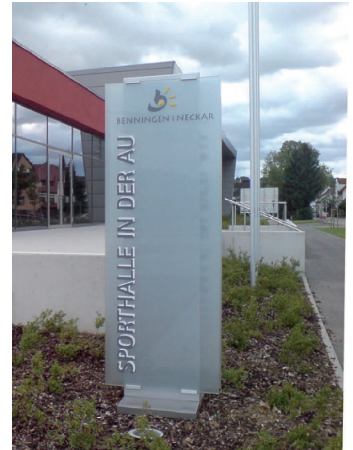
Monolith im Aussenbereich